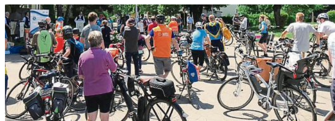
Ja, sie sind mit dem Radl da – offizielle Begrüßung der Stadtrader:innen aus den Nachbarkommunen.